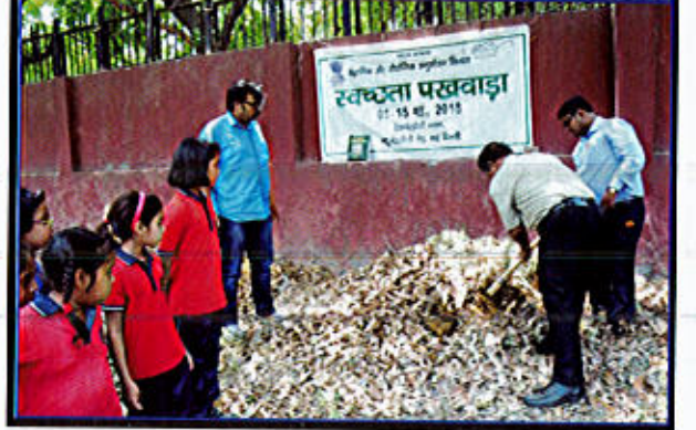
चित्र 6 स्वच्छता पखवाड़े के दौरान स्कूली बच्चों को जैव-खाद का प्रदर्शन करते हुए