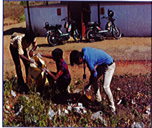
चित्र 8 (ख)