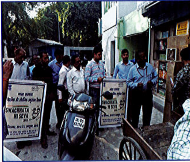
चित्र 9 स्वच्छता ही सेवा के संदेश को फैलाते हुए तथा स्थानीय लोगों के साथ बात करते हुए डीएसआईआर के अधिकारी तथा कर्मचारी

2. डीएसआईआर ने क्रियाकलापों की एक श्रृंखला के आयोजन द्वारा 15 सितम्बर, 2018 से 2 अक्टूबर, 2018 के प्रभाव से "स्वच्छता ही सेवा" (एसएचएस)- 2018 पखवाड़ा मनाया जिसमें श्रमदान, पुरानी/लुप्त प्रायः फाइलों/रिकार्डों को निकालना, कमरों/हॉलों तथा आस-पड़ोस के क्षेत्रों इत्यादि की बड़े स्तर पर सफाई सम्मिलित थी। डीएसआईआर के अधिकारियों तथा कर्मचारियों द्वारा इस मुद्दे पर जागरूकता फैलाने के लिए नजदीकी स्थलों तथा स्थानीय बाजार तक एक रैली निकाली गई।