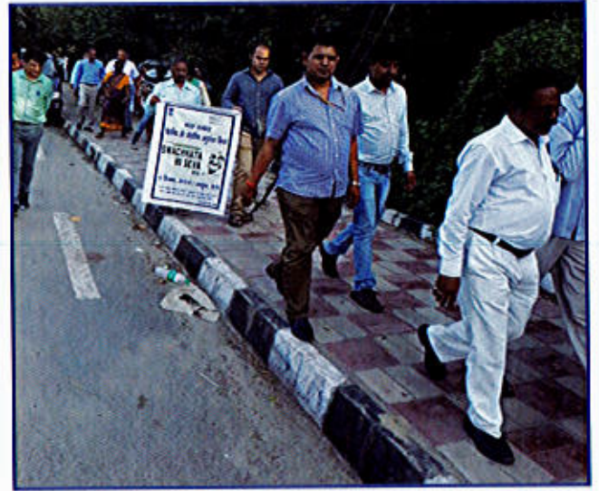
चित्र 10 स्वच्छता ही सेवा रैली में भाग लेते हुए डीएसआईआर के अधिकारी एवं स्टाफ के सदस्य