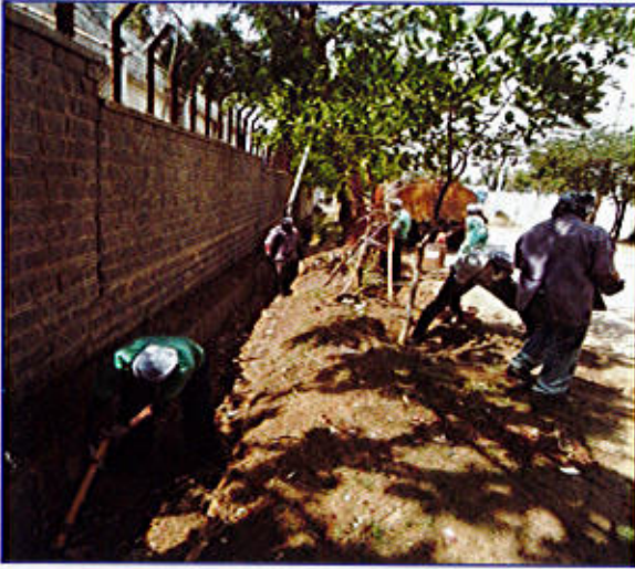
चित्र 8 (क)

(VI) डीएसआईआर के हितधारकों को 1-15 मई, 2018 के दौरान "स्वच्छता पखवाड़े" मनाने के कार्यों में लगाया गया। डीएसआईआर की वैबसाईट पर सहभागीदारी का आह्वान किया गया। डीएसआईआर द्वारा मान्यता प्राप्त उद्योग की कई अनुसंधान एवं विकास ईकाईयों तथा साइरो ने अपने कार्यालयों तथा आस-पड़ोस के क्षेत्रों में स्वच्छता संबंधी कार्यशालाओं एवं सेमीनारों, पौधा रोपण कार्यों तथा स्वच्छता संबंधी कार्यों द्वारा स्वच्छता पखवाड़ा मनाया। उन्होंने पड़ोसी स्थानीय जगहों, गावों तथा विद्यालयों में व्यक्तिगत साफ-सफाई और स्वच्छता पर परस्पर जागरूकता अभियानों का भी आयोजन किया।