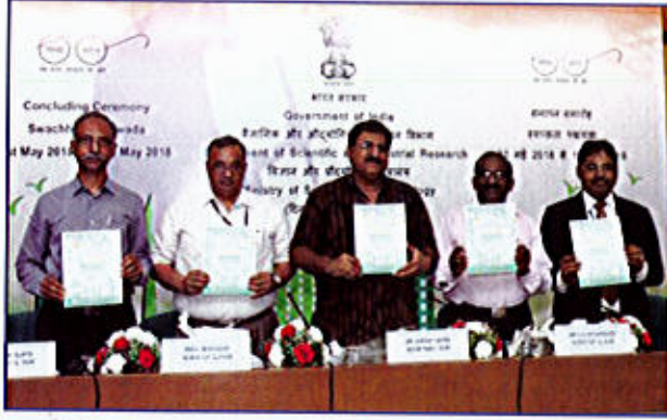
चित्र 3 स्वच्छता पखवाड़े के समापन समारोह के दौरान स्वच्छता संकलन का विमोचन करते हुए सचिव, डीएसआईआर