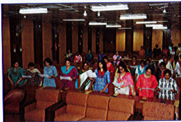
चित्र 1 स्वच्छता पखवाड़ा, 2018 के उदघाटन समारोह में स्वच्छता शपथ लेते हुए कार्मिक

डीएसआईआर के सभी कार्मिकों ने श्रमदान में भाग लिया तथा अवांछित फाईलों और रिकार्डों को छांटने, कार्यस्थलों और कार्यालय परिसरों की सफाई करने के लिए सघन साफ-सफाई कार्य किए गए। डीएसआईआर के कर्मियों ने स्वच्छता पर पोस्टर तथा स्लोगन प्रतिस्पर्धा में भाग लिया। पोस्टर तथा स्लोगन की प्रविष्टियों को कार्यालय परिसरों में सूचना पट्ट पर प्रदर्शित किया गया।