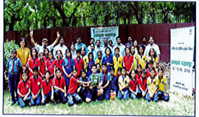
चित्र 5 अपशिष्ट से धन संबंधी जागरूकता अभियान में भाग लेते हुए स्कूली बच्चे