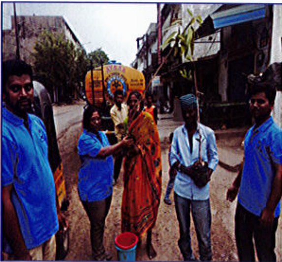
चित्र 8 (ग)