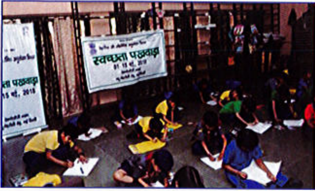
चित्र 7 स्वच्छता विषय पर पोस्टर प्रतिस्पर्धा में भाग लेते हुए स्कूली विद्यार्थी

(VI) डीएसआईआर के हितधारकों को 1-15 मई, 2018 के दौरान "स्वच्छता पखवाड़े" मनाने के कार्यों में लगाया गया। डीएसआईआर की वैबसाईट पर सहभागीदारी का आह्वान किया गया। डीएसआईआर द्वारा मान्यता प्राप्त उद्योग की कई अनुसंधान एवं विकास ईकाईयों तथा साइरो ने अपने कार्यालयों तथा आस-पड़ोस के क्षेत्रों में स्वच्छता संबंधी कार्यशालाओं एवं सेमीनारों, पौधा रोपण कार्यों तथा स्वच्छता संबंधी कार्यों द्वारा स्वच्छता पखवाड़ा मनाया। उन्होंने पड़ोसी स्थानीय जगहों, गावों तथा विद्यालयों में व्यक्तिगत साफ-सफाई और स्वच्छता पर परस्पर जागरूकता अभियानों का भी आयोजन किया।