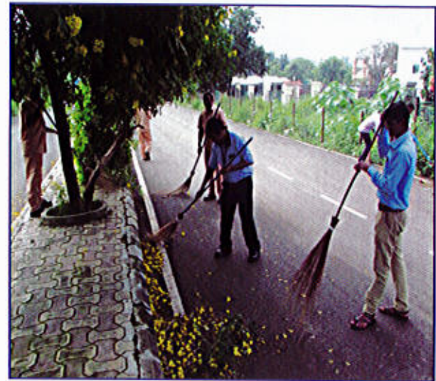
चित्र 8 (घ)

चित्र 8 स्वच्छता पखवाड़े के दौरान विभिन्न स्वच्छता गतिविधियां करते हुए डीएसआईआर के हितधारक