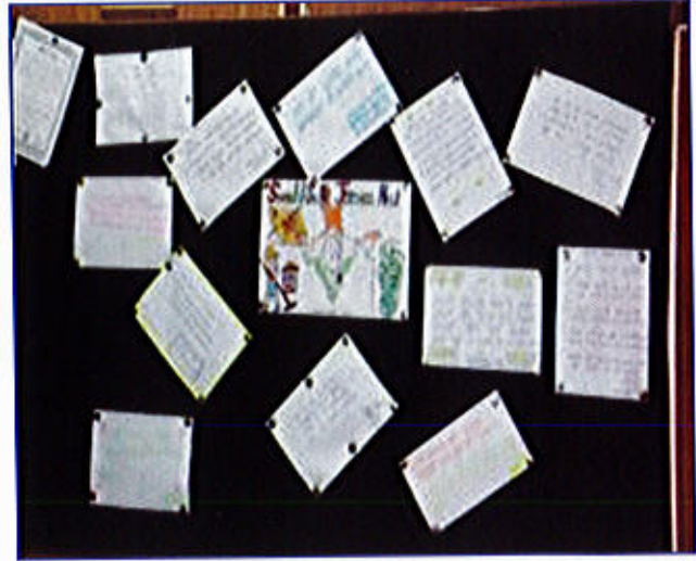
चित्र 2 डीएसआईआर कार्यालय परिसरों में सूचनापट्ट पर प्रदर्शित स्वच्छता संबंधी पोस्टर तथा स्लोगन की प्रविष्टियों

श्री नरेंद्र मोदी, माननीय प्रधानमंत्री, भारत सरकार ने सर्वव्यापक स्वच्छता सुरक्षा हासिल करने के प्रयासों को तेज करने तथा इस ओर ध्यान केंद्रित करने और सुलभ साफ-सफाई तथा स्वच्छता पर जागरूकता फैलाने के लिए 2 अक्टूबर, 2014 से स्वच्छ भारत मिशन (एसबीएम) की शुरुआत की। स्वच्छ भारत अभियान महात्मा गांधी के स्वच्छ और स्वास्थ्यकर भारत के सपने को पूरा करने के लिए भारत सरकार के महत्वपूर्ण अग्रणी कार्यक्रमों में से एक है। डीएसआईआर ने डीएसआईआर-स्वच्छता कार्य-योजना के अंतर्गत डीएसआईआर के अधिकारियों तथा कर्मचारियों की सक्रिय सहभागीदारी से कार्यालय परिसर के भीतर विभिन्न गतिविधियों का आयोजन किया।