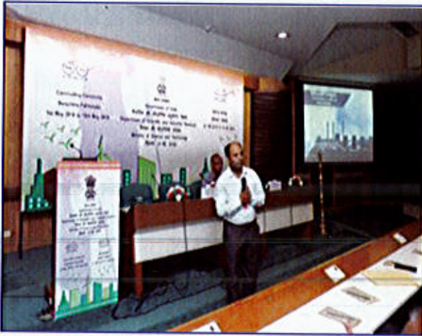
चित्र 4 "स्वच्छता पखवाड़ा समापन समारोह" के दौरान तकनीकी सत्र में व्याख्यान देते हुए एक सहभागी